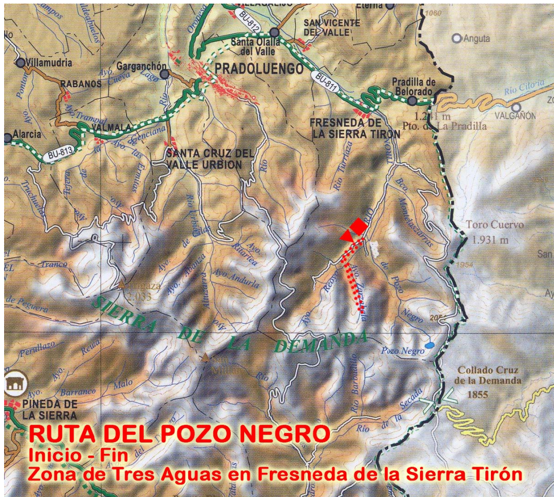
Mapas fuente Diputación Provincial de Burgos