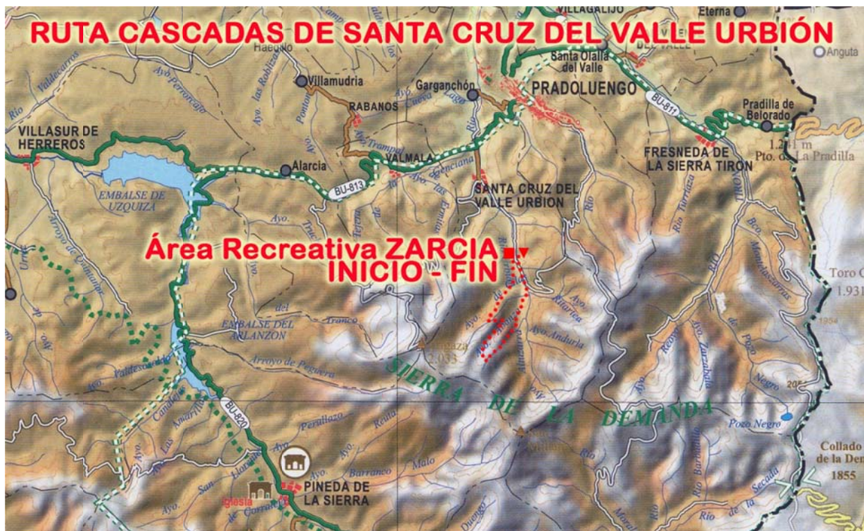
Mapas fuente Diputación Provincial de Burgos